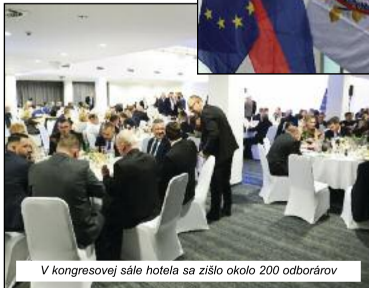
V kongresovej sále hotela sa zišlo okolo 200 odborárov

tak často nevidajú, vždy je však s nimi o čom klábovať a na čo spomínať. Neostáva, len úprimne poďakovať všetkým, ktorí sa pričinili o dôstojný a príjemný slávnostný večer, na ktorý budú všetci účastníci ešte roky spomínať.