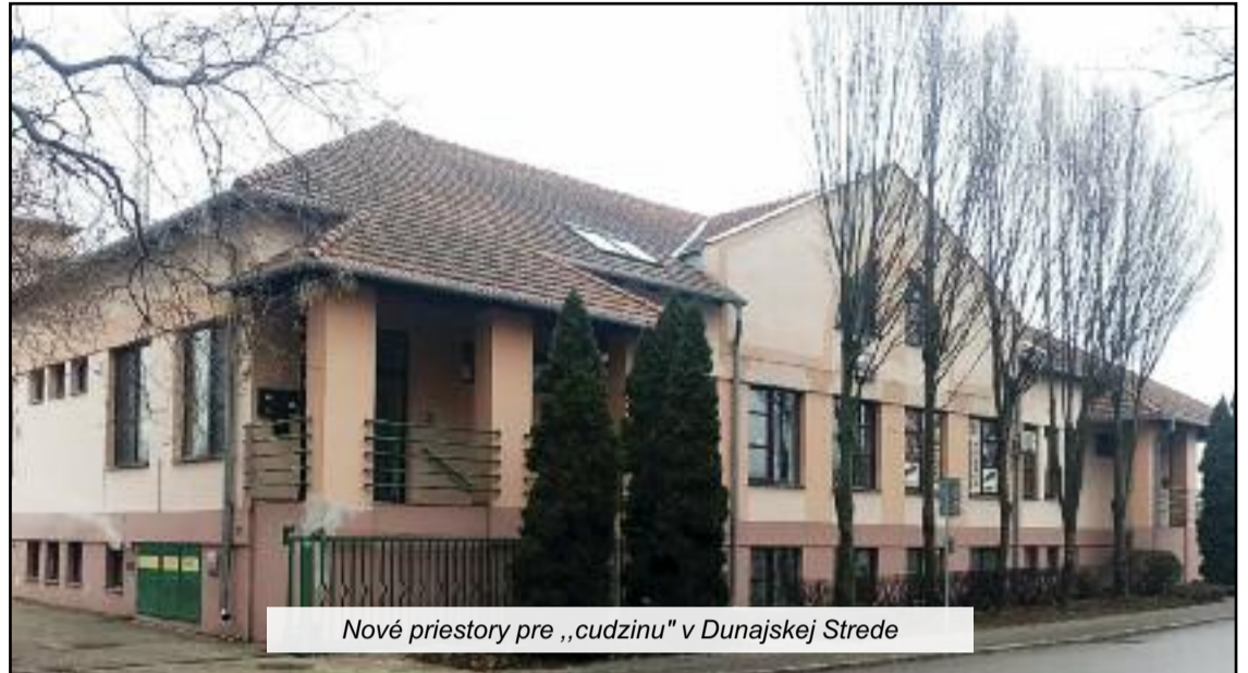
Nové priestory pre „cudzinu“ v Dunajskej Strede

Podmienky prijímania stránok „na cudzine“ v Dunajskej Strede boli celé roky hanbou Slovenska. Nové, dôstojné priestory praco-