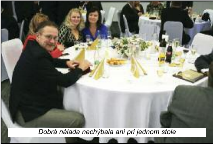
Dobrá nálada nechýbala ani pri jednom stole

(Pokračovanie zo strany 1) plaketami OZP v SR. //Ich mená prinášame na inom mieste – pozn. red./