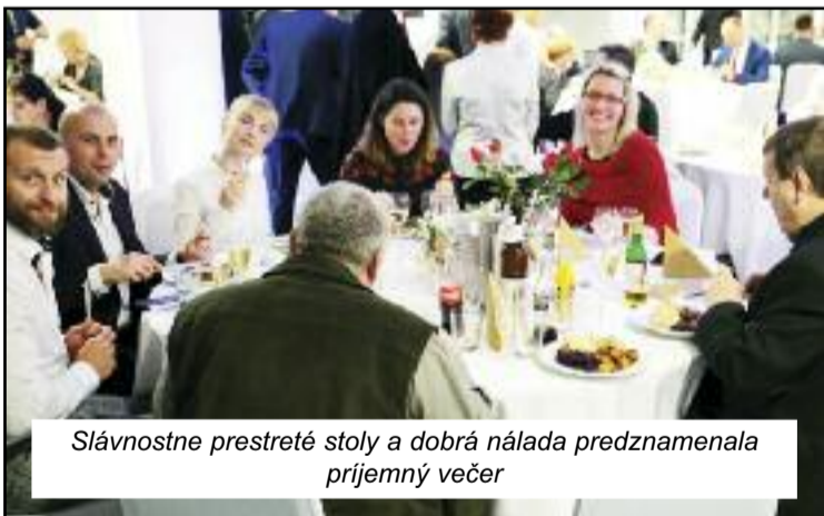
Slávnostne prestreté stoly a dobrá nálada predznamenala príjemný večer