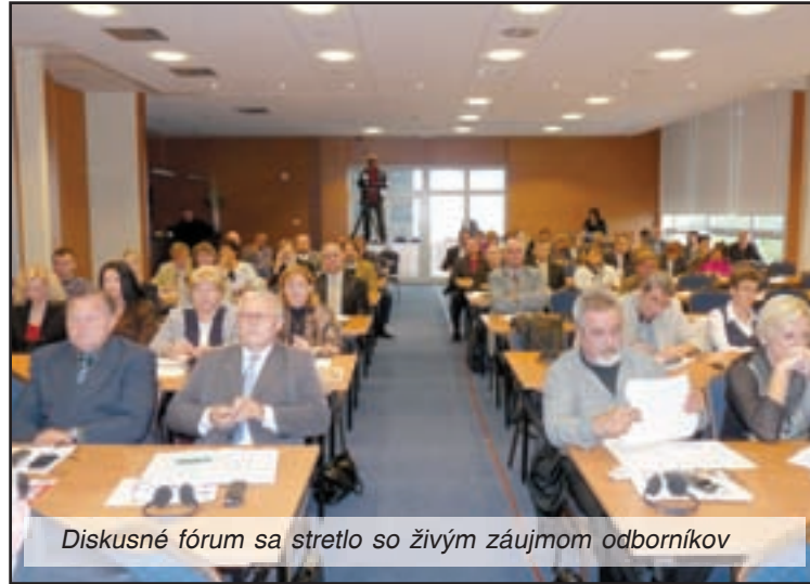
Diskusné fórum sa stretlo so živým záujmom odborníkov