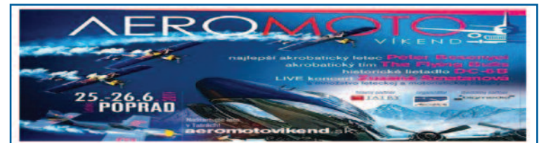
Dňa 26.06.2011 sa deti z Detského domova Spišská Belá zúčastnili akcie na Letisku Poprad - Tatry – AERO-MOTO VÍKEND 2011.