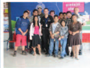
rýchlo zareagovali a oboznámili