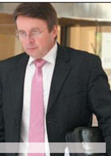
Jozef Mihál a Ivan Mikloš

Odôvodnenie: Návrh zákona je v rozpore so schválenou Konceptiou reformy daňovo-odvodového systému, ktorú schválila Vláda SR na svojom zasadnutí dňa 18. 5. 2011.