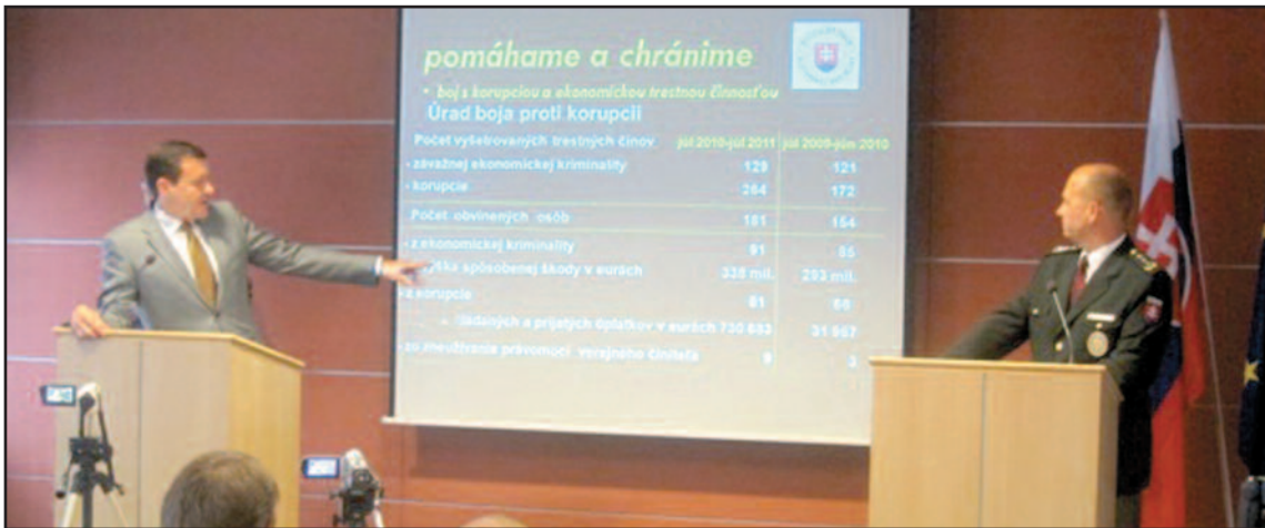
Vedenie rezortu vnútra odprezentovalo pred novinármi výsledky ministerstva a polície za prvý rok pôsobenia.

nila, to je naše základné heslo. Ak sa nám bude dariť znižovať počet násilných trestných činov, odhaľovať ich páchatelov, ak sa nám bude dariť rozkladať zločinecké skupiny, aby nikto v krajine nemohol stáť nad zákonom, tak to bude veľký úspech policajného zboru a samozrejme, že najmä policajtov, ktorí za týmto úspechom stoja. Lebo chcem sa poďakovať na záver v rámci celého rezortu, nielen policajtom, aj hasičom, záchranárom, civilným zamestnancom, ale menujem policajtov, tak mnohí z nich nie sú mediálne známi, mnohí z tých, ktorí pracujú na najzávažnejších prípadoch organizovanej kriminality alebo korupcie, nie sú známi ľuďom ani vám médiám, ale mnohí z nich odvádzajú veľmi poctivú prácu a preto im patrí určite aj v tomto okamihu moja vďaka. Sú policajti, ktorí by tam nemali čo hľadať, s nimi sa snažíme tiež vysporiadať, budem mať k tomu osobitnú tlačovú konferenciu, lebo som menoval pred niekoľkými dňami nového šéfa policajnej inšpekcie, očakávam, že bude v tomto smere tiež dôraznejší, ale to si necháme na inokedy. Ďakujem pekne.“ (r)